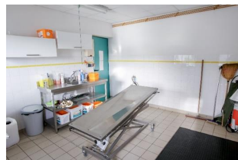
Chirurgie des veaux